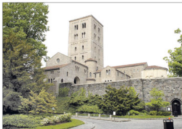
The Cloisters , construido en terrenos donados por John Rockefeller.