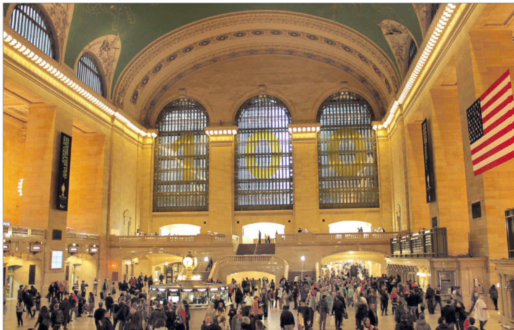
Grand Central Terminal , en febrero pasado cumplió un siglo. Una vista del hall Vanderbilt, de 1.100 metros cuadrados y techo abovedado.

En la actualidad ingresan más de 100 mil personas por día, entre los que se cuentan usu-